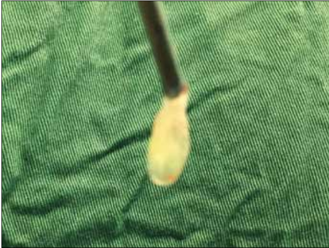
Рис 3. Новообразование левого желудочка. Пинцет фиксирует основание опухоли. Опухолевая ткань окружена физраствором