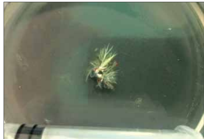
Рис. 5. Макроструктура удаленной папиллярной фиброэластомы, помещенной в физиологический раствор

Проведенное патогистологическое исследование подтвердило предполагаемый характер новообразования, которое оказалось папиллярной фиброэластомой.