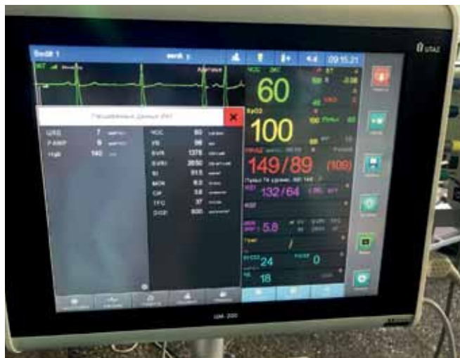
Фото 1. Показники гемодинаміки пацієнта

Інтраопераційний моніторинг гемодинаміки здійснювався за допомогою монітору фірми UTAS моделі UM300 з адаптованим до нього модулем ICG. До початку операції кожному з обстежуваних нами пацієнтів приєднували електроди для реєстрації показників ICG, 5 електродів для реєстрації ЕКГ, на монітор виводили криву артеріального тиску, зареєстровану прямим методом вимірювання, а також показник центрального венозного тиску. Для обчислення індексу доставки кисню вводили показник гемоглобіну кожного пацієнта та його антропометричні дані. Таким чином, до початку операції мали показники гемодинаміки кожного пацієнта, як показано на фото 1.