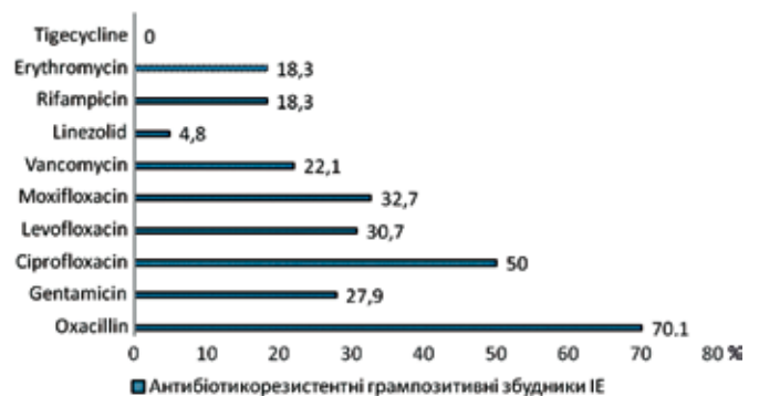
Рис. 1. Частота реєстрації резистентних штамів грампозитивних збудників ІЕ до антибактеріальних препаратів (n=104)

Таким чином, проведений аналіз показує, що серед грампозитивних мікроорганізмів інфекційного ендокардиту реєструється 70,1% оксацилінрезистентних збудників: отже, для 2/3 хворих у схемі емпіричної антибіотикотерапії не можуть бути застосовані препарати пеніцилінового та цефалоспоринового ряду. Тому в цих хворих необхідно застосовувати альтернативні