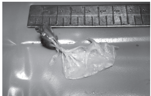
Рис. 1, 2. Відрив папілярного м'яза